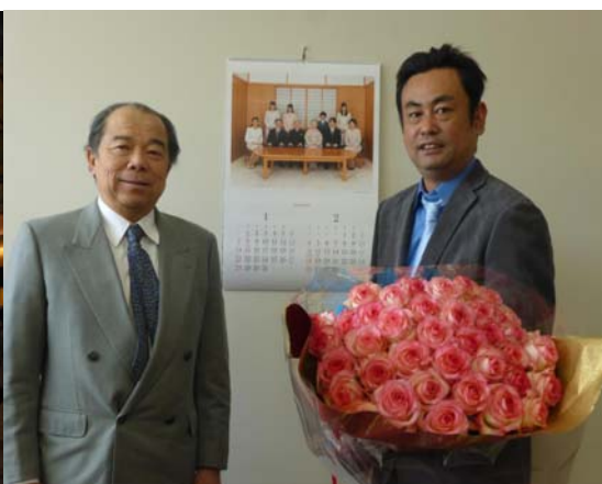
浅岡氏とツーショット