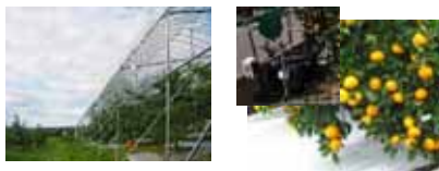
屋根かけ栽培 マルドリ方式