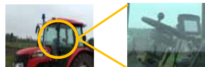
【GPS自動操舵システムの導入】