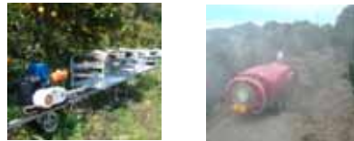
モノレール スピードスプレーヤー